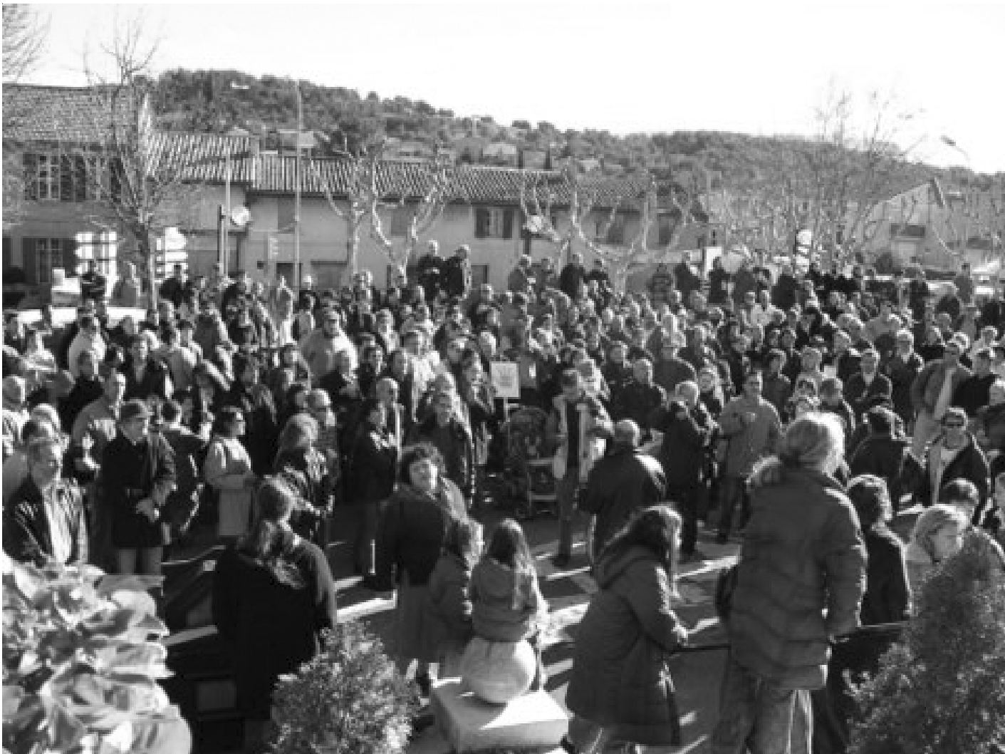
Manifestation pour la sauvegarde de l'OMCJ, devant la Mairie, le 22 janvier 2005

* Le groupe des Quinze représente M. le Maire et les 14 Conseillers Municipaux qui soutiennent encore sa politique.