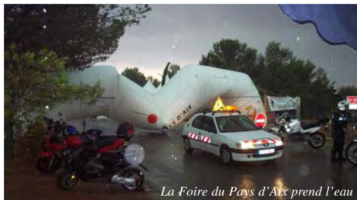
La Foire du Pays d'Atx prend l'eau

avait les pieds au sec, alors qu'avec un tel orage par le passé il fallait pomper.